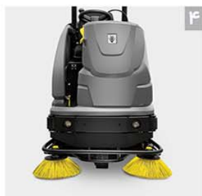
۴ قابلیت نصب حفاظ یا سقف بالای سر اپراتور

نصب حفاظ در مکان های پر خطر و در فضاهای باز از لحاظ ایمنی بسیار پراهمیت است.