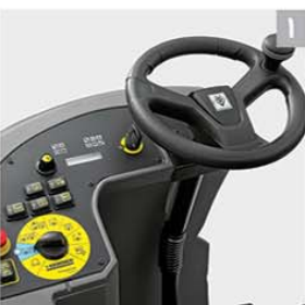
۱ سیستم کارایی بهینه (Eco Efficiency)

در حالت استفاده از این سیستم میزان مصرف آب، سرعت چرخش برس و قدرت مکش به صورت اتوماتیک در بهینه ترین سطح خود قرار می گیرد و باعث صرفه جویی در مصرف آب و توان باتری دستگاه می گردد.